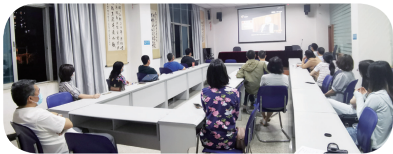
（云南省健康教育所党支部）

为认真贯彻落实省委、省纪委省监察委关于肃清秦光荣流毒影响部署要求，切实教育引导广大党员干部进一步强化廉洁自律意识，提高政治警觉，根据省卫生健康委机关纪委《关于认真组织观看〈政治掮客苏洪波〉警示教育片的通知》要求，所党支部组织全体党员及中层以上干部约 20 人，于首播当晚 5 月 7 日，在中心二楼会议室，集体观看了警示教育片《政治掮客苏洪波》。