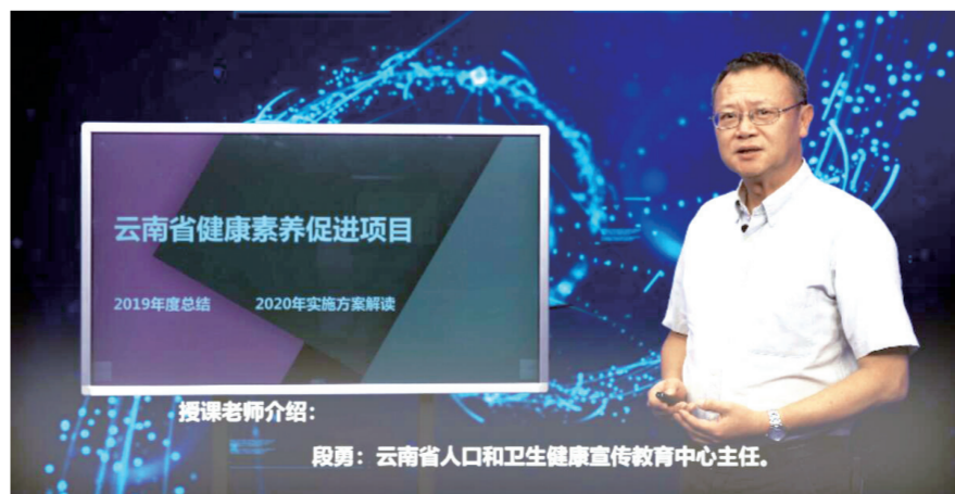
授课老师介绍： 段勇：云南省人口和卫生健康宣传教育中心主任。